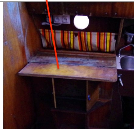
Siège de veille