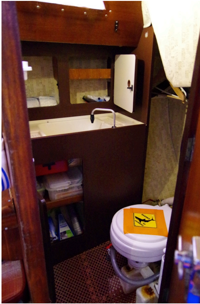
Armoire de toilette et pharmacie