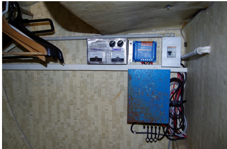
Ampèremètre indicateur de charge et de conso électrique