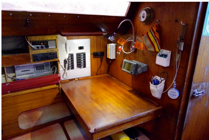
Table à carte et radios 1 veilleuse blanche 1 lampe orientable blanche ou rouge Cablage AIS en place

Nombreux rangements et bibliothèque pour livres de poche